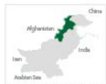
Processed & prepared by the PPAF GIS Laboratory