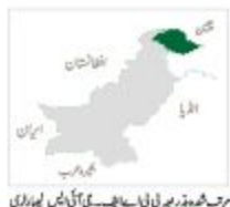
موجودہ دور میں پی پی اے ایف کی آئی ٹی میں موجودگی