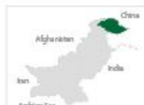
Processed & prepared by the PPAF GIS Laboratory

Presence in 10 districts through 08 partner organisations