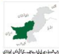
موجودہ ڈیٹا پی پی اے ایف کی آلہ کار کی موجودگی